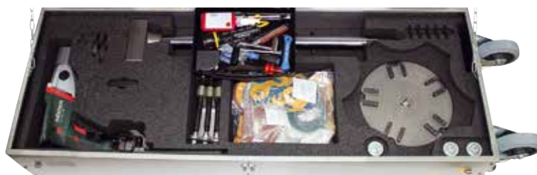
VENTA 300 trnsportný box a príslušenstvo