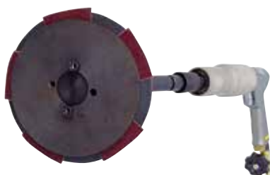
VENTA 150 pohon s brúsnyim kotúčom

Veľkú rozsah brusiva podľa jemnosti aj veľkosti, disky a segmenty s brusivom z oxidov hliníka, karbidov kremíka alebo oxidov zirkónu nanosené na rôznych nosičoch, napr aj DIAPLAN - CBN (= Cubic Boron Nitride). Toto veľmi agresívne a galvanicky lepené brusivo je taktiež ponúkané na brúsnych diskoch.