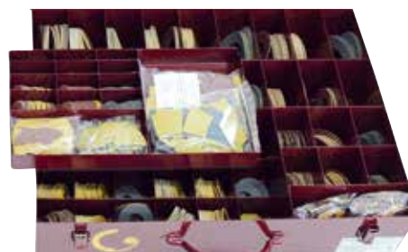
VENTA 150 prepravný box s abrazívom