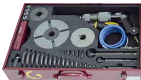
VENTA 150 prepravný box