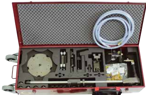
SLIM 300 transportný box s príslušenstvom

Vysoko agresívne brusivo CBN (Cubic Boron Nitride) na brúsnych hlavách.