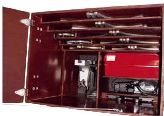
SLIM 1000 transportný box s príslušenstvom