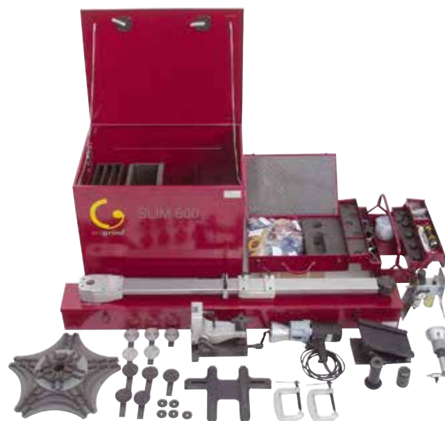
SLIM 600 rozsah dodávky