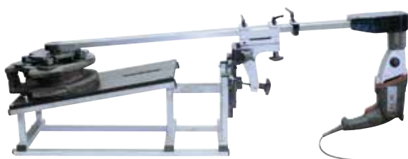
SLIM 300 zabrusovanie klinov posúvačov