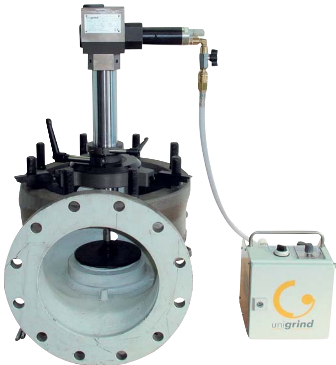
SVS 1 osadená na poistný ventil