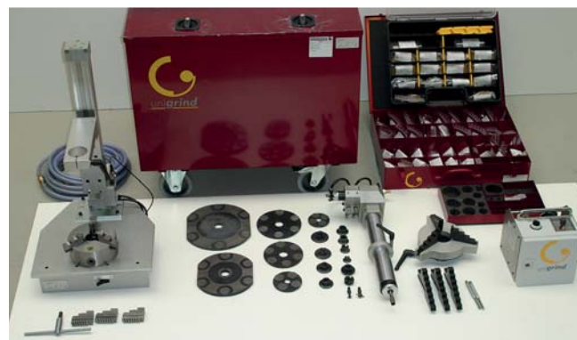
SVS 1 rozsah dodávky