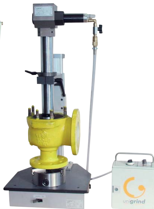
SVS 1 grinding a valve on machine stand