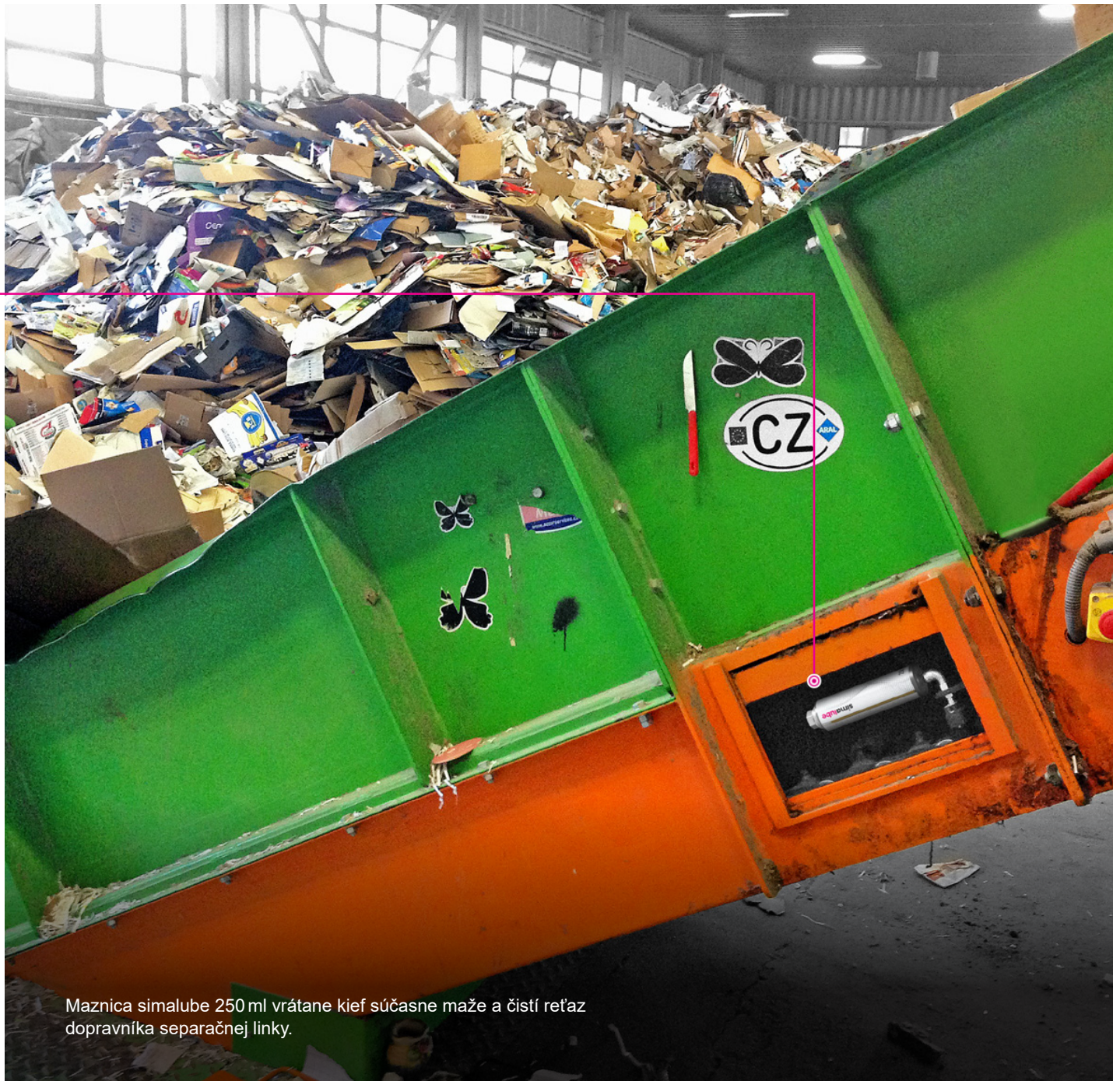
Maznica simalube 250 ml vrátane kief súčasne maže a čistí reťaz dopravníka separačnej linky.