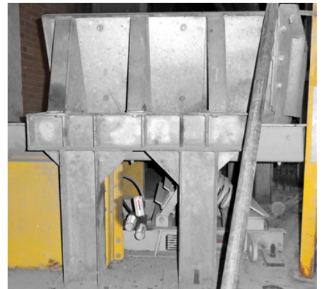
Vibračný dopravník mazaný niekoľkými maznicami simalube 125 ml.