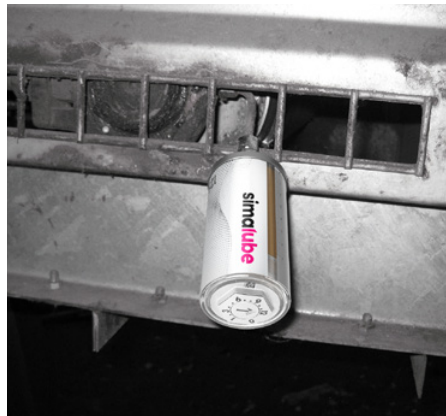
simalube maže ložiská na pásovom dopravníku.