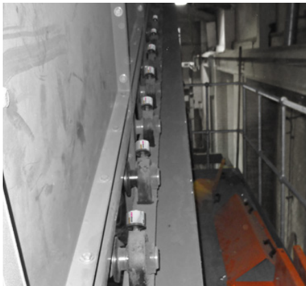
Desiatky mazníc simalube 30 ml dodávajú potrebné mazivo ložiskám pásového dopravníka.