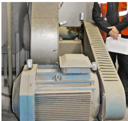
Spaľovací ventilátor mazaný dvomi 60 ml a dvomi 125 ml maznicami simalube.