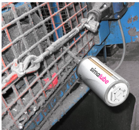
Maznice simalube z vonkajšej strany zabráňujú vniknutiu nečistôt do mazacieho bodu.

«simalube zvyšuje bezpečnosť zamestnancov na pracoviskách»