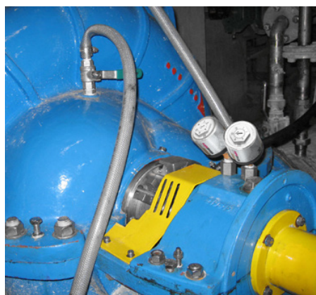
Dve 30 ml jednotky simalube premazávajú ložiská čerpadla.