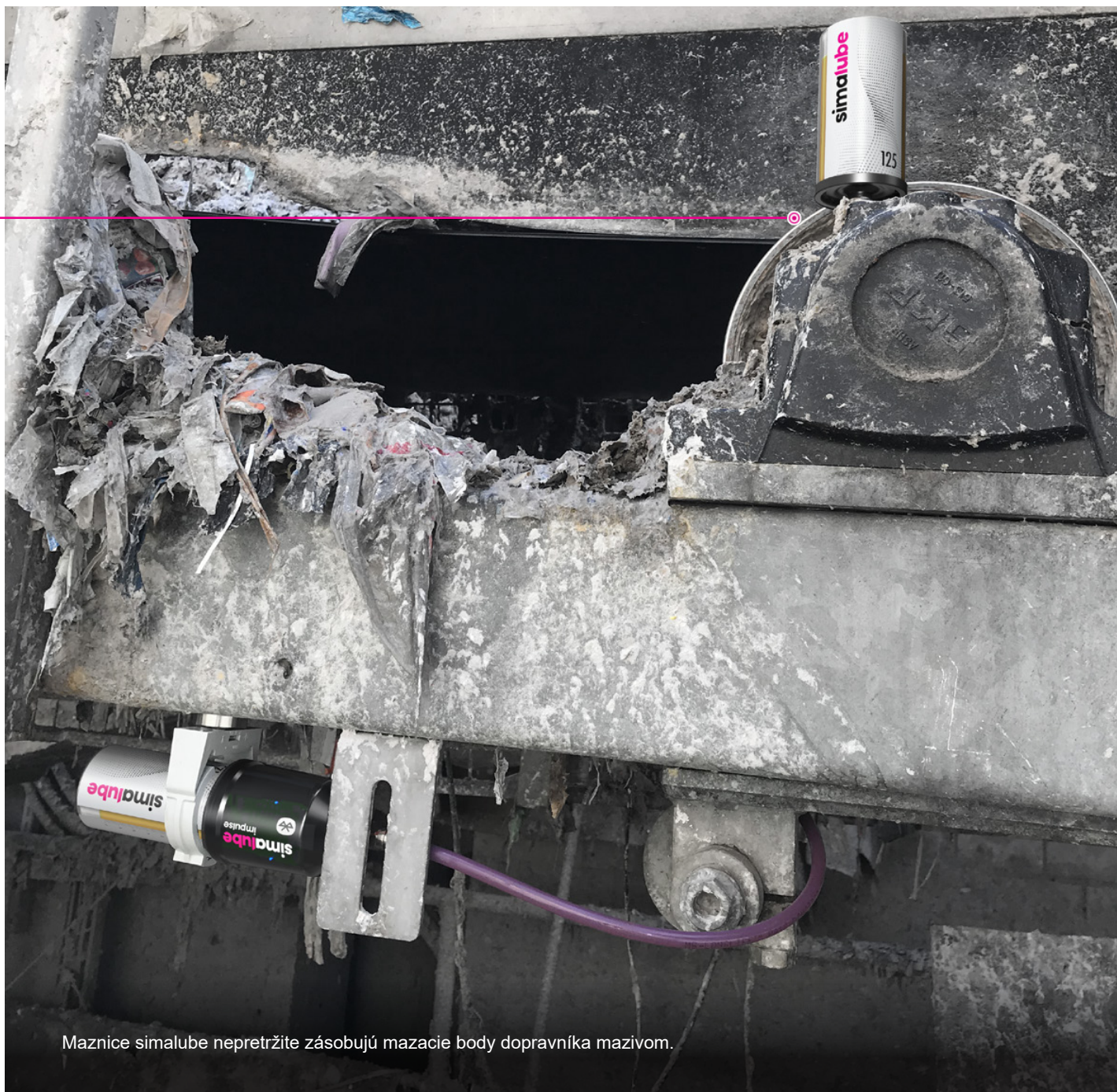
Maznice simalube nepretržite zásobujú mazacie body dopravníka mazivom.