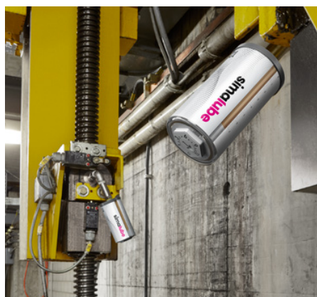
Vretená zdvihacej plošiny pre železničné vagóny a lokomotívy sú mazané 125 ml simalube maznicou po dobu 12 mesiacov.