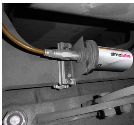
125 ml dávkovač je nainštalovaný na podvozku nízkopodlažnej električky. Mazivo je nasmerované k mazaciemu bodu pomocou hadičky.