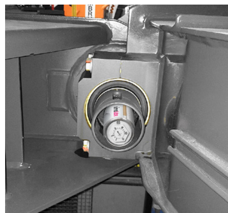
Spojka medzi dvoma železničnými vozňami je mazaná maznicou simalube 125 ml.