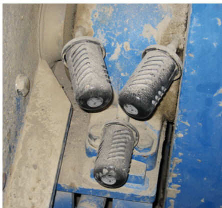
Ochranné kryty, ktoré chránia maznicu pred poškodením v dôsledku pôsobenia extrémnych vonkajších vplyvov.