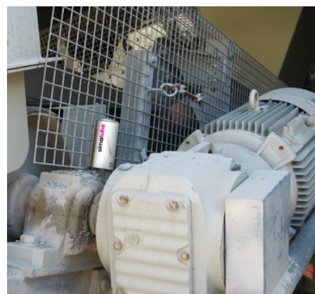
Zvislé ložisko na pásovom dopravníku sa maže maznicou simalube.