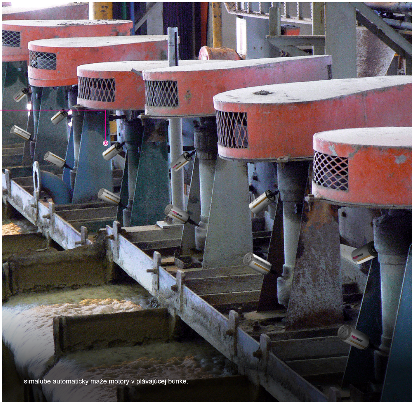
simalube automaticky maže motory v plávajúcej bunke.