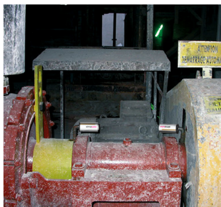
Nepretržité mazanie ložísk na hlavnom hnacom hriadeli filtračného čerpadla.