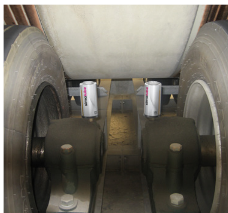
Maznice sú pripojené priamo k zvislému ložisku na pohone pásového dopravníka.