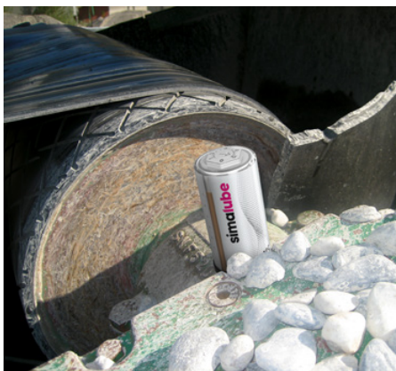
Remenný pohon mazaný pomocou simalube.

«simalube znižuje ná- klady a zvyšuje bezpeč- nosť na pracovisku»