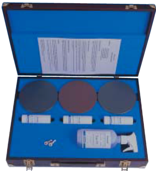
Lapovacie dosky pre lapovanie a leštenie