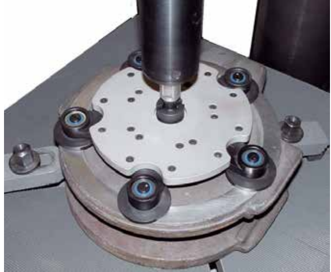
Brúsenie dielu posúvača brúsnymi diskami