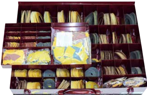
Sada abrazív VENTA - samolepiace