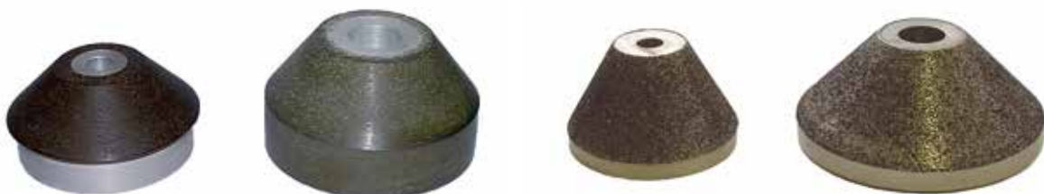
CBN brúsne kužele