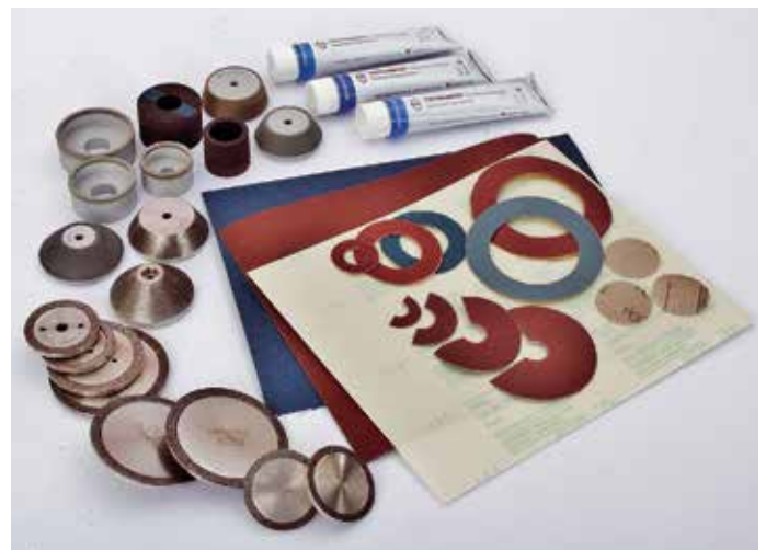
Rôzne abrazívne prostriedky a prípravky