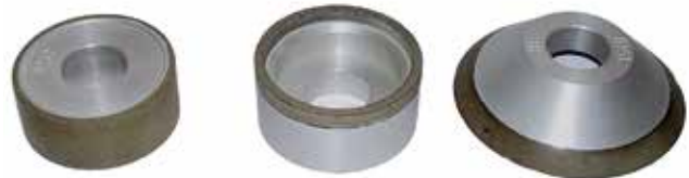
CBN brúsne kamene rôznych tvarov a veľkostí