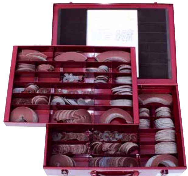
Sada abrazív KVS - samolepiace