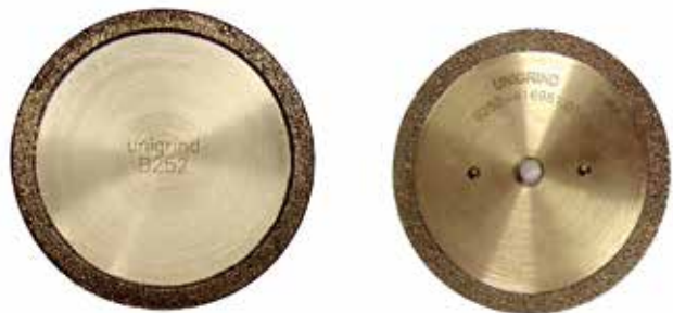
Brúsne disky DIAPLAN BOR