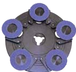
Planétové disky s nalepeným brusivom