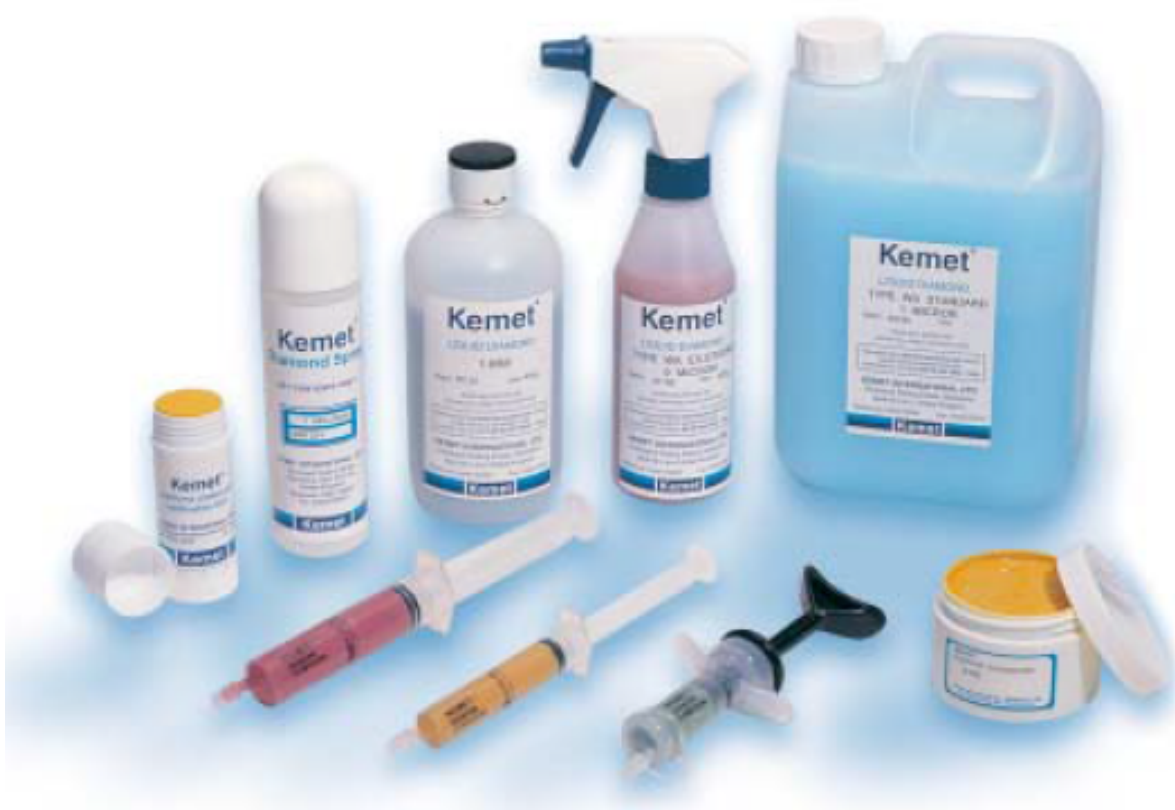
Brúsne prípravky, pasty, roztoky v rôznych formách a baleniach