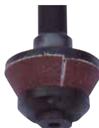
Brúsne kužele s nalepeným brusivom